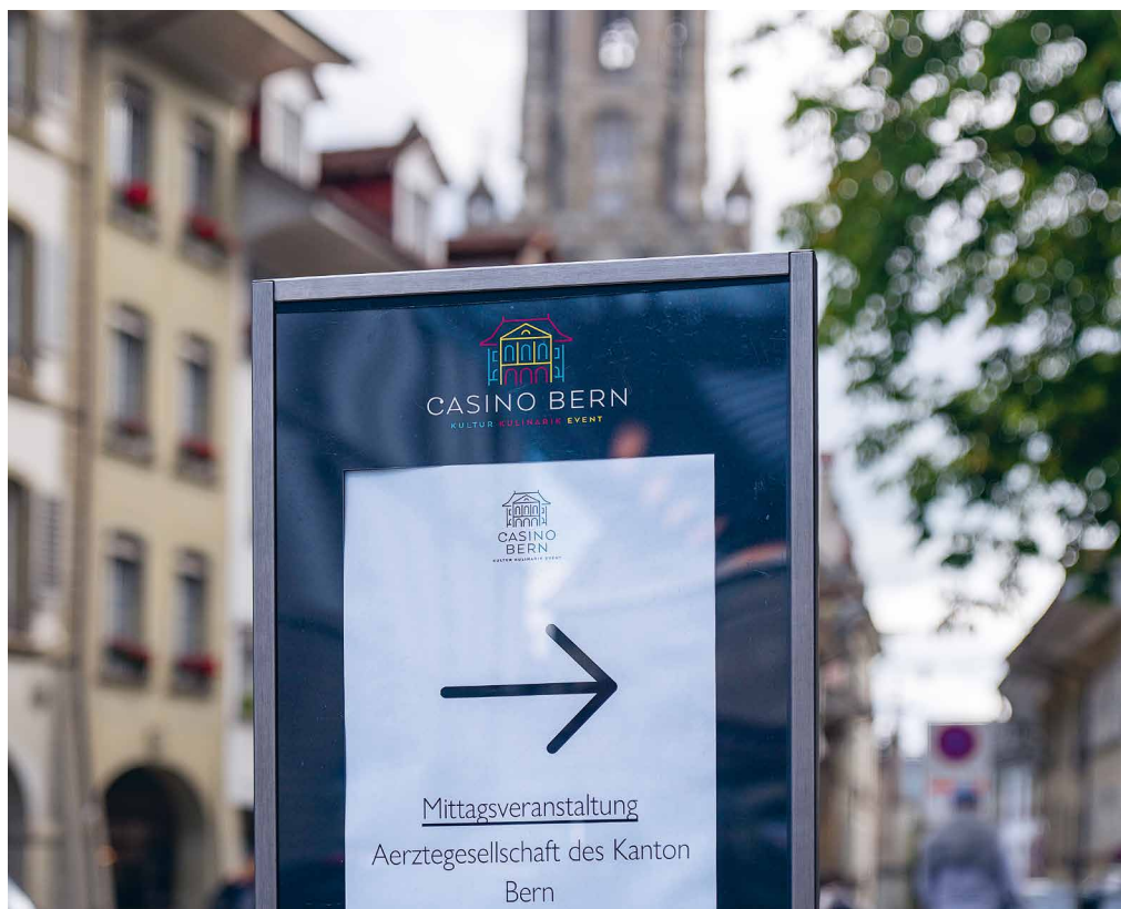
En 2024, la rencontre de mi-journée avec les membres du Grand Conseil s'est tenue au Casino de Berne.