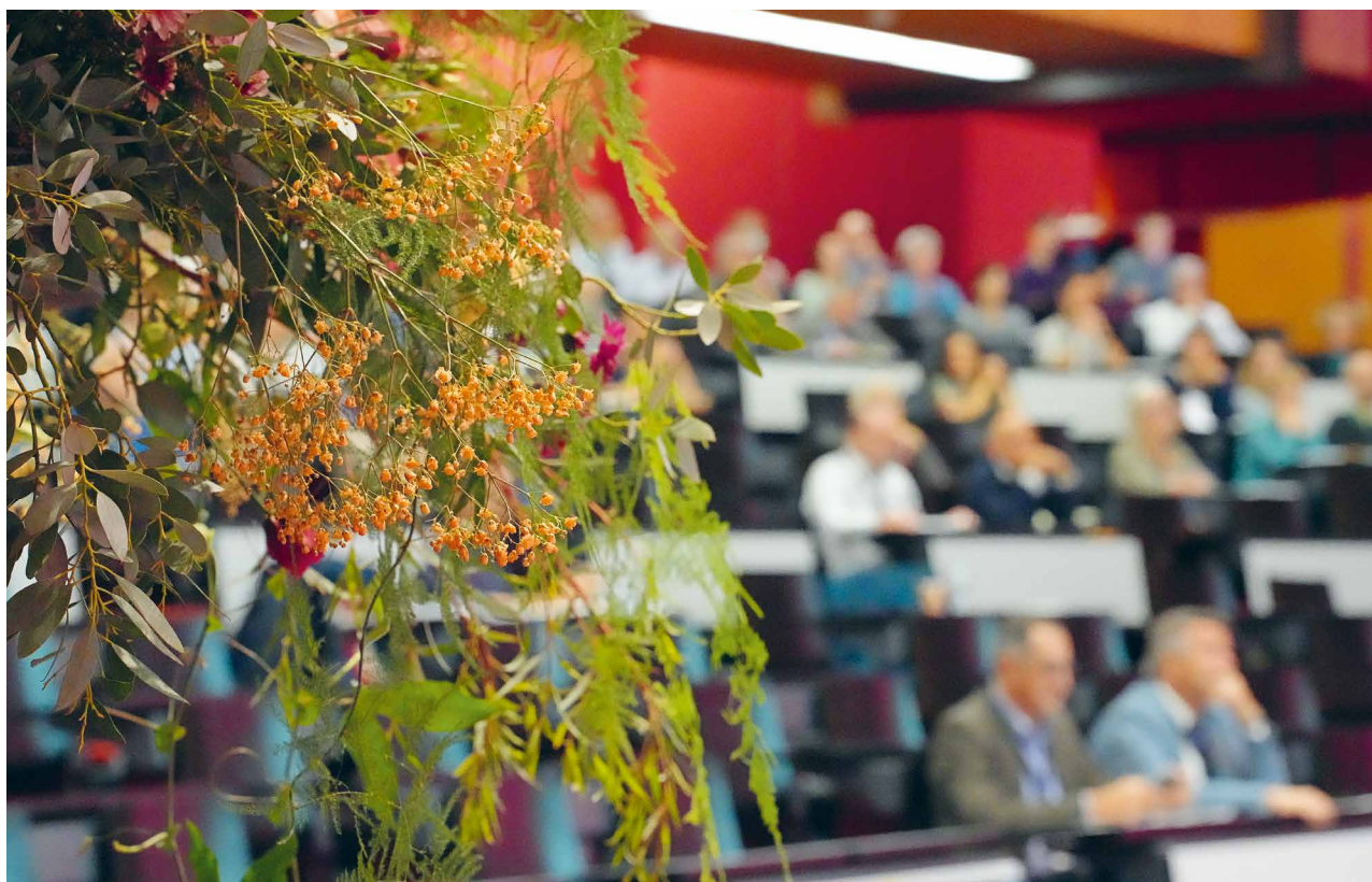
Un des grands moments de 2024 : l'ouverture des BETAKLI '24.

fin 2024, des travaux préparatoires ont en outre été menés avec le CM de Haute-Argovie et le CM de Pierre-Pertuis, qui lanceront également ce projet pilote dans leurs secteurs respectifs à partir de début 2025. Par ailleurs, la participation au projet pilote est ouverte à d'autres cercles médicaux.