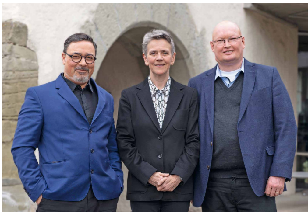
La présidence de la SMCB, réélue par acclamation, continuera à représenter les intérêts des médecins du canton de Berne au cours de la législature 2024–2027.

l'administration, afin de décharger les médecins scolaires de ces tâches. Enfin, le système de délégation tient compte du fait qu'en raison de la pénurie de médecins, des tâches autrefois considérées comme relevant de leur compétence exclusive doivent (et peuvent !) aujourd'hui être remplies, du moins pour partie, par des professionnels qualifiés, mais non-médecins.